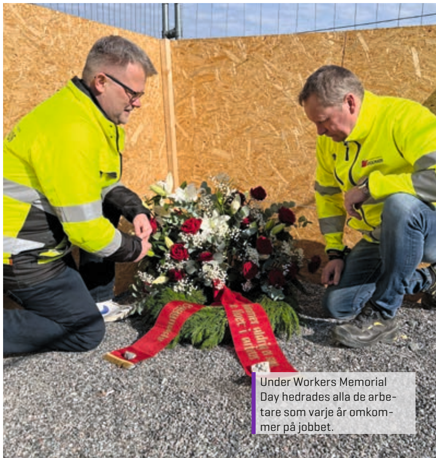
Under Workers Memorial Day hedrades alla de arbetare som varje år omkommer på jobbet.