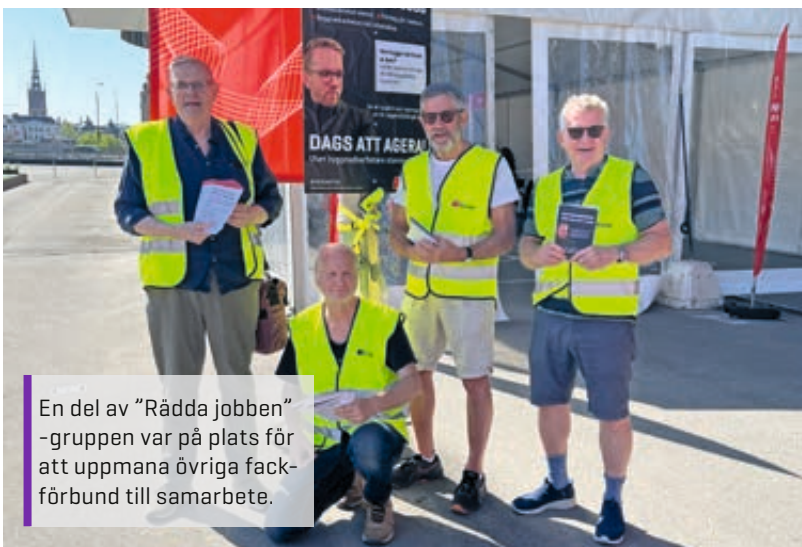
En del av "Rädda jobben"-gruppen var på plats för att uppmana övriga fackförbund till samarbete.