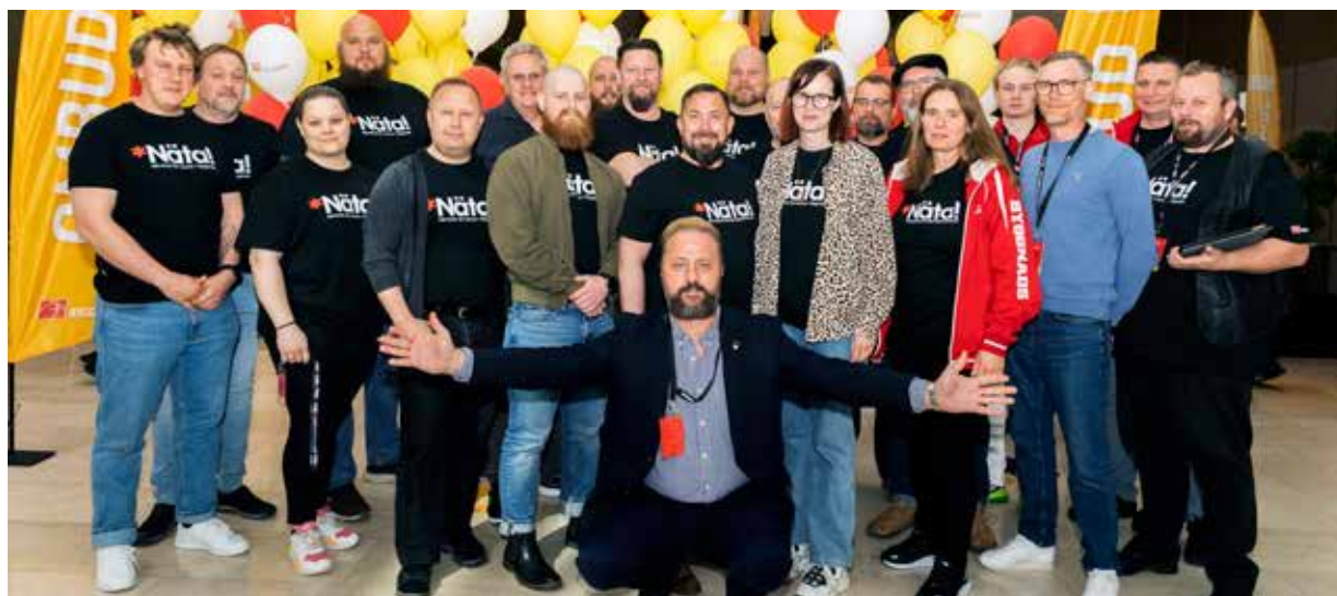
Kongressgruppen från region Stockholm-Gotland bestod av 21 ombud, som var med och tog beslut på Byggnads kongress.

En ny vision för hur Byggnads ska jobba de kommande åren och stopp för att bjuda på alkohol för medlemmarnas pengar. Det är två av sakerna som bestämdes på Byggnads kongress som var i slutet av maj.