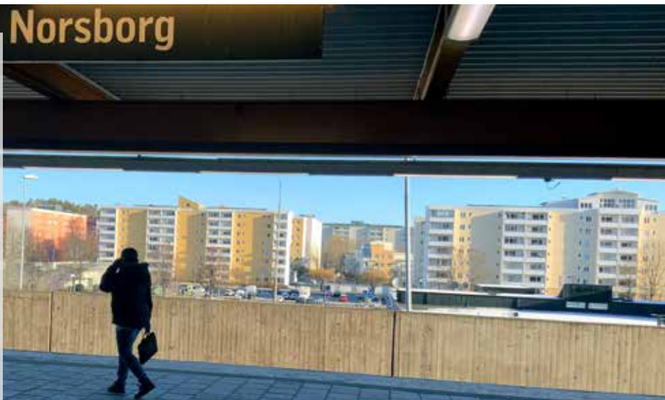
Dagen börjar med tunnelbana från Norsborg tidigt på morgonen.

Det är tufft att få orken att räcka till för att gå iväg och läsa svenska för invandrare, efter att ha rengjort golv en hel arbetsdag.