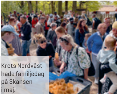
Krets Nordväst hade familjedag på Skansen i maj.

Välkommen till din krets nästa medlemsmöte! Information om tid och plats får du på sms inför varje möte.