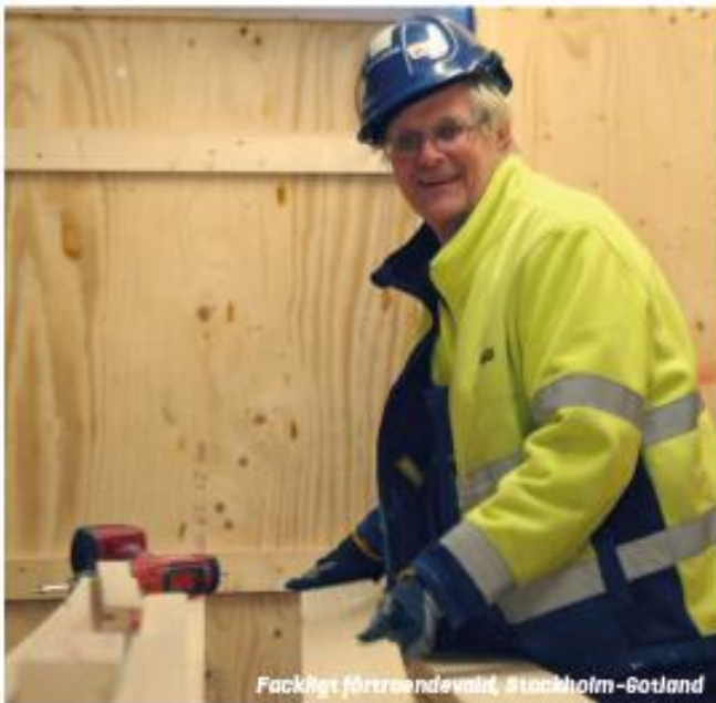
Fackligt förtroendevald, Stockholm-Gotland

I uppdraget som fackligt förtroendevald har man fått arbetskamraternas förtroende och utsetts av regionstyrelsen för att vara Byggnads förlängda arm på arbetsplatsen men också medlemmarnas kanal in i organisationen. Det innebär bland annat att man ansvarar för att förmedla facklig information, i båda riktningarna, mellan arbetskamraterna på arbetsplatsen och regionen.