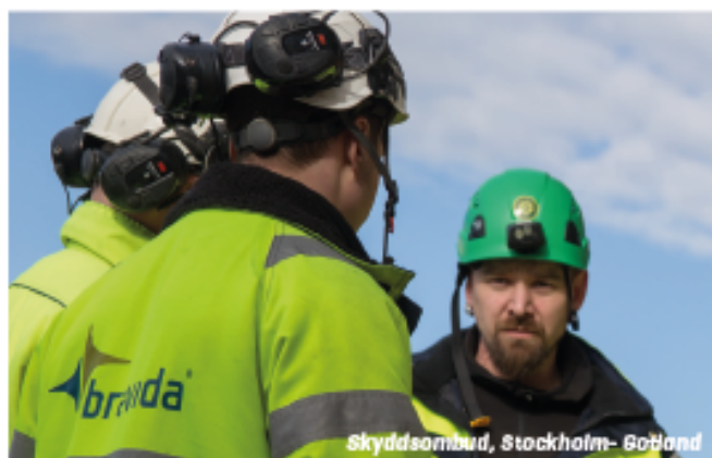
Skyddsombud, Stockholm- Gotland

Skyddsombudets uppgift är att, som fackligt förtroendevald, företräda arbetskamraterna i arbetsmiljörelaterade frågor i kontakt med arbetsgivaren. Detta när arbetstagaren inte kan lösa problemet direkt med sin närmaste chef. Arbetet vilar i grunden på Arbetsmiljölagen med tillhörande föreskrifter. En viktig utgångspunkt i lagstiftningen är att båda parter, dvs arbetsgivare och arbetstagare, tillsammans ska verka för en god arbetsmiljö. Det är dock alltid arbetsgivaren som är ytterst ansvarig för arbetsmiljön. Uppdraget och uppgifterna som skyddsombudet har är mycket viktiga eftersom det ytterst handlar om medlemmarnas liv och hälsa.