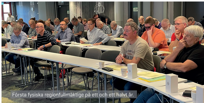
Första fysiska regionfullmäktige på ett och ett halvt år.