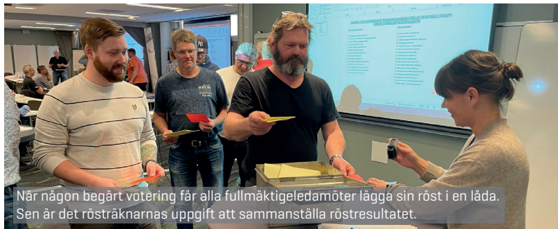
När någon begärt votering får alla fullmäktigeledamöter lägga sin röst i en låda. Sen är det rösträkarnas uppgift att sammanställa röstresultatet.

Nästa regionfullmäktige hålls 2 december med fokus på budgeten för 2022.