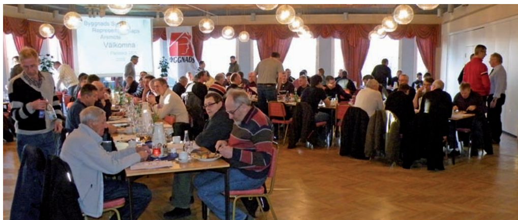
Den beslutande församlingen vid representantskapets årsmöte 2009

är gemensamt ansvarig för avdelningens verksamhet. Ledamöterna väljs på representantskapets årsmöte i mars. Styrelsen sammanträder 5/5, 2/6, 1/9, 2/10, 3/11 och 1/12 2009.