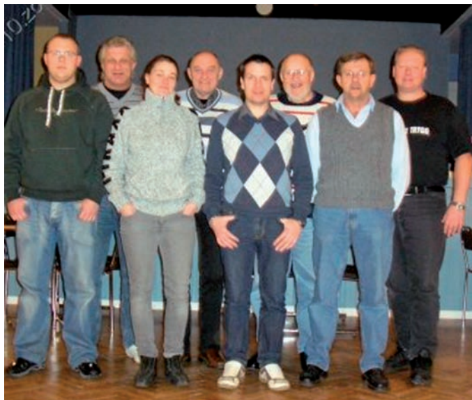
Sektion 10 Ekeby