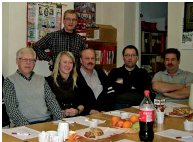
Sektion 09 Klippan