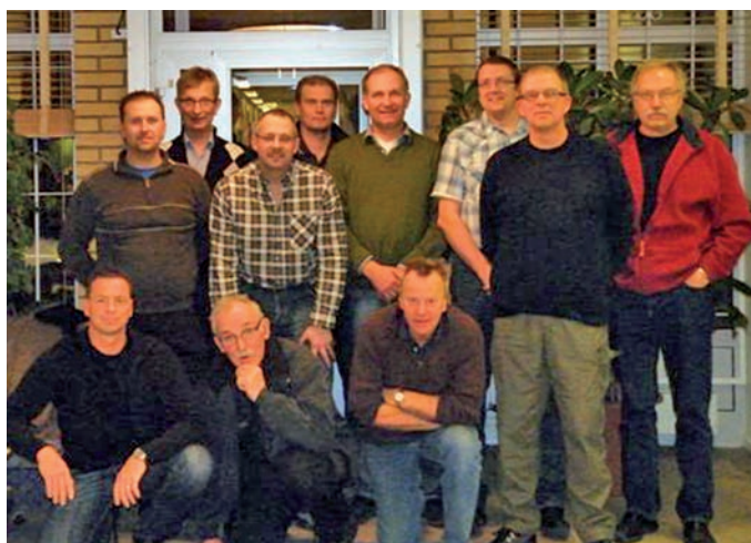
Sektion 01 Helsingborg