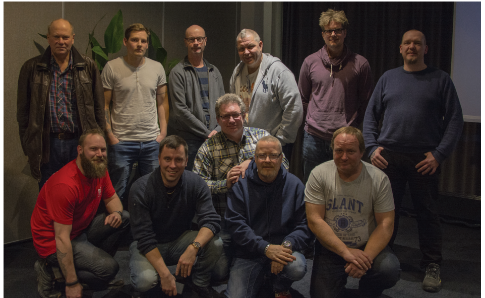
Nyvalda avtalsrådet (tre personer var frånvarande).

arbetarna i arbetslivet och i livets olika skeden behöver vi satsa på att Byggnads får en utökad politisk påverkan på alla nivåer. Det kommer att gynna byggnadsarbetare både på fritiden och på jobbet. Alla byggprojekt är beroende av politiska beslut och vi måste säkra en grundtrygghet eftersom våra medlemmar arbetar i en bransch som är både olycksdrabbad och konjunkturkänslig.