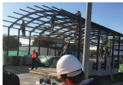
Byggställningar används sparsamt till förmån för alternativa lösningar.