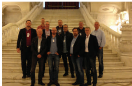
Byggnads delegation i parlamentspalatset.

Studiebesöket var mycket givande och gav både nya kontakter och insikter. Nu har vi större förståelse när vi möter rumänska arbetare på våra byggarbetsplatser.