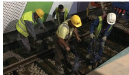
Mycket av det arbete som vi gör maskinellt i Sverige, görs med handkraft i Rumänien.