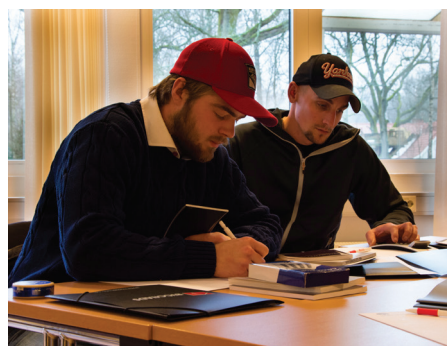
Deltagarna räknar på egen hand för att förstå lönesystemet.