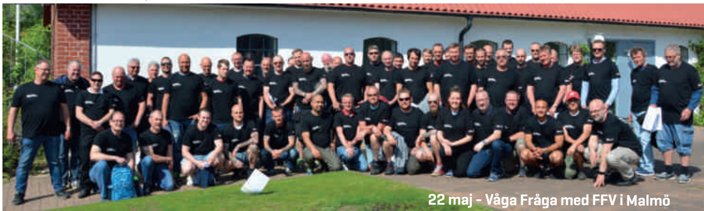
22 maj - Våga Fråga med FFV i Malmö