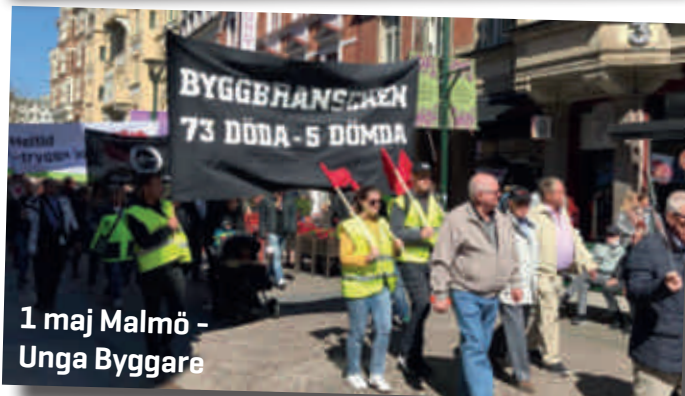
1 maj Malmö - Unga Byggare