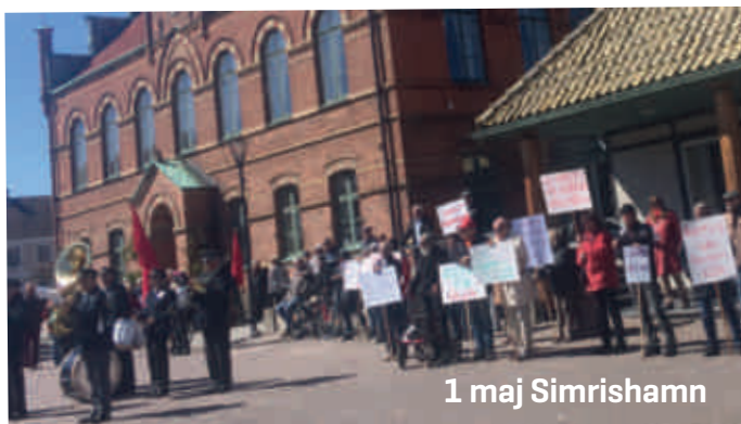
1 maj Simrishamn