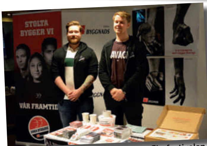
5-6 maj Nordiska Arbetarfilmfestivalen