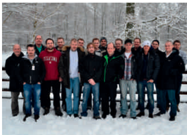
Utbildningsdeltagarna på På Rätt Väg 4-6 februari 2013

Stämningen var god och alla deltog med brinnande intresse!