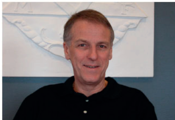
Tveka inte att höra av er!

Medlemsutvecklingen, jag vill framföra ett stort tack till alla som gör en insats för att värva och behålla medlemmarna i världens bästa fackförening Byggnads Södra Skåne!