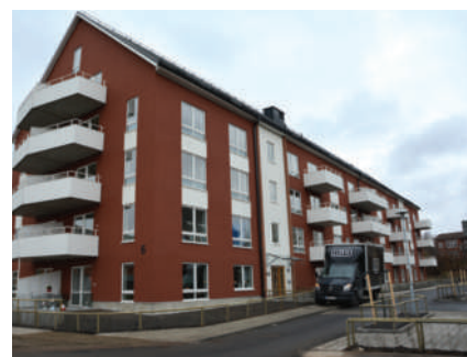
Inflyttning pågår i de precis färdiga husen