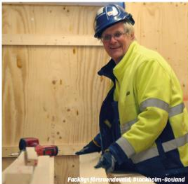
Fackligt förtroendevald, Stockholm-Sotland

I uppdraget som fackligt förtroendevald har man fått arbetskamraternas förtroende och utsetts av regionstyrelsen för att vara Byggnads förlängda arm på arbetsplatsen men också medlemmarnas kanal in i organisationen. Det innebär bland annat att man ansvarar för att förmedla facklig information, i båda riktningarna, mellan arbetskamraterna på arbetsplatsen och regionen.