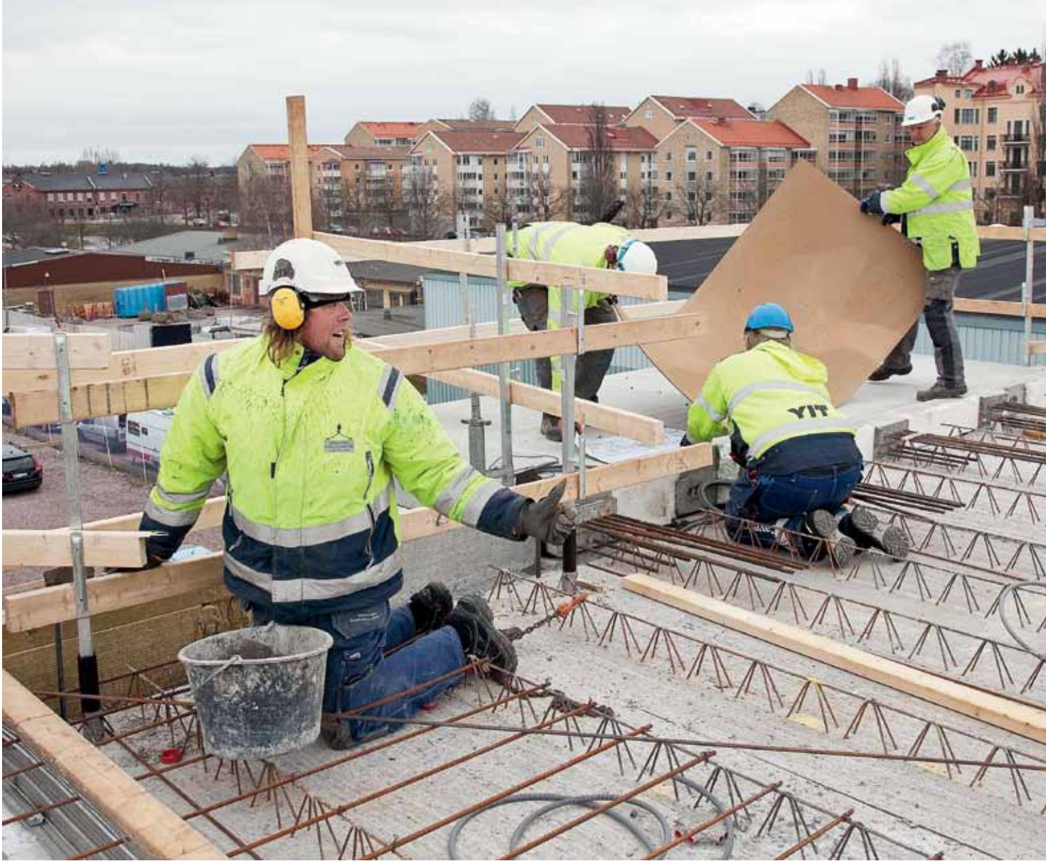
På torsdagar pågår installationsarbeten inför kommande gjutning.