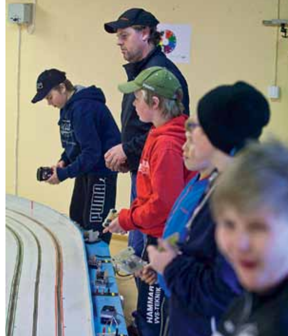
Även om det bara handlar om träning så blir det förstås tävling till sist.