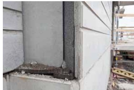
1,5 meter ovan mark byggs första våningsplanet för att garantera att inte översvämning från Vänern tar sig in i huset.