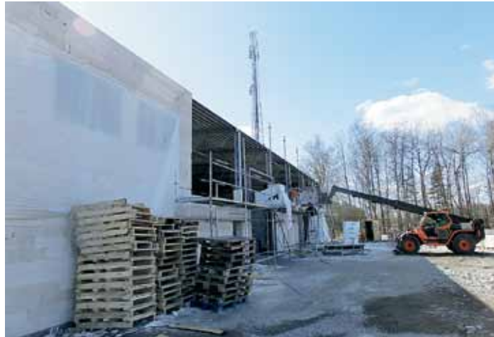
Det nya avtalet om huvudentreprenörsansvar kan på sikt få bort oseriösa byggföretag, hoppas Byggnads.

Bilden har bekräftats av många. Både myndigheter, forskare, artiklar i media, företagare och fackliga representanter har beskrivit hur det ser ut. Många av våra ombudsmän runt om i Sverige möter ofta denna typ av problematik med utnyttjande och avtalsbrott. De kan berätta om massor med händelser och