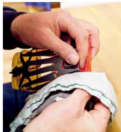
Det är mycket trix med bilarna. Precis som i en riktig rallytävling.