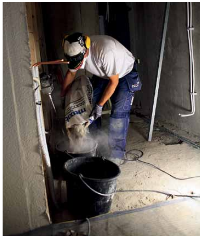
Byggnadsarbetare utsätts ofta för farliga ämnen, tunga lyft och stress. Efter många år i yrket dyker lätt arbetsskadorna upp. Byggnads kan hjälpa till med handläggning av försäkringsärenden. Det är en medlemsförmån.