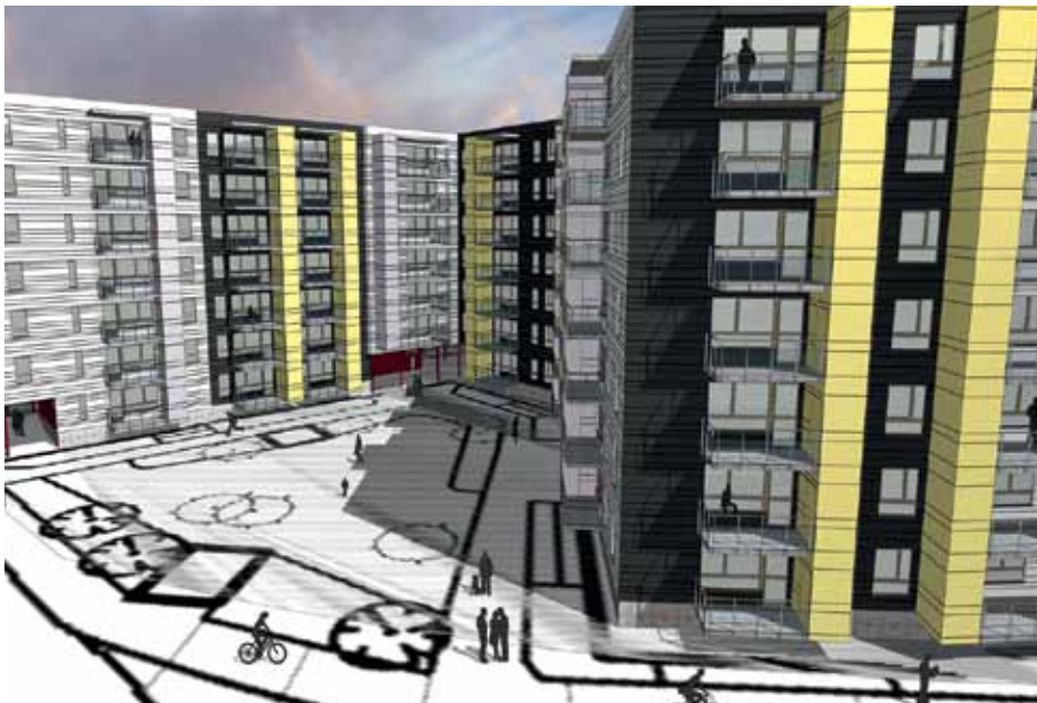
Så här kommer fastigheten att se ut färdigbyggd.