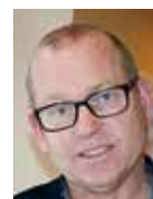
Johan Lindholm förbundsordförande Byggnads

Det behövs mycket mer av nybyggnation, modernisering av miljonprogramsområden och hållbar klimatanpassad infrastruktur. Med tanke på alla de samhällsproblem sådant byggande kan lösa borde satsningarna kunna betalas ur många politikområdens och samhällssektorer budgetar och med lån.