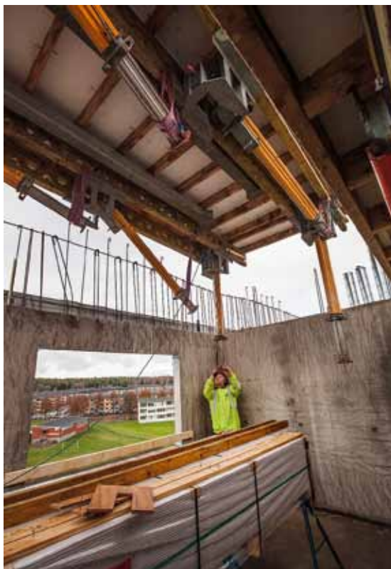
...och här tas det emot på rätt våning.