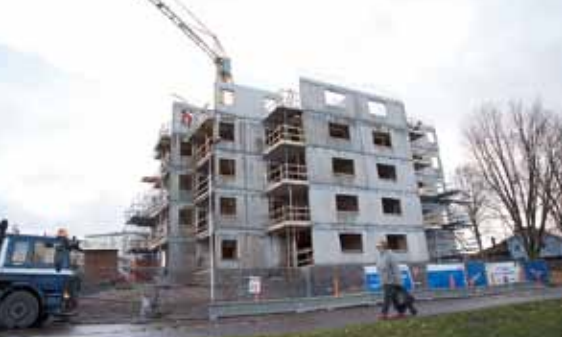
I Karlstad bygger NCC sitt eget projekt, Folkboende.