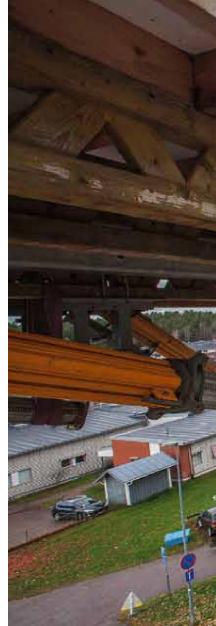
NCC bygger ett hyreshus i Wäxnäs.