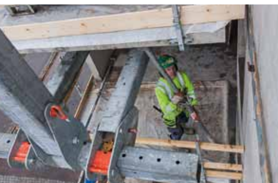
Här är valvbordet en bit upp...