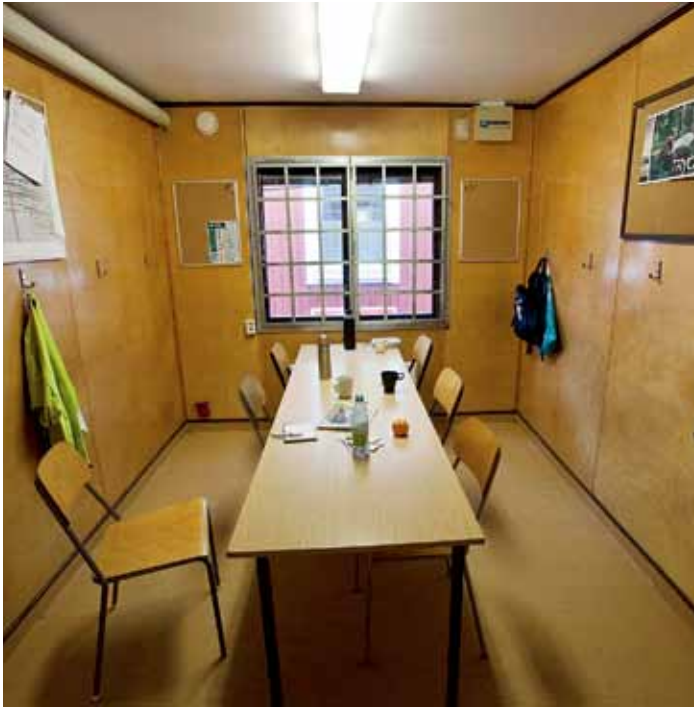
Nuvarande personalutrymmen uppfyller kraven om högst sex personer använder boden.

Följande krav på personalutrymmet gäller från den 1 januari 2015.