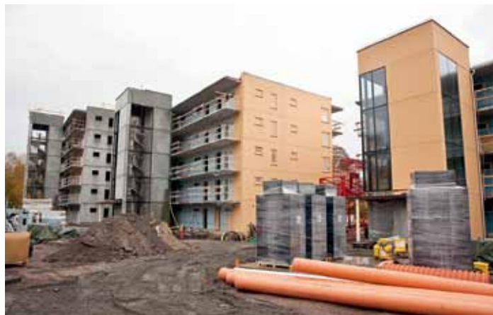
Elms byggnadsfirma bygger tre punkthus vid Klarälven i Karlstad. Byggherren Karlstadshus har satsat lite extra på inredning och mervärde för hyresgästerna.

Alldeles intill Klarälvens strand i Karlstad bygger Elms Byggnadsfirma 60 hyreslägenheter åt Karlstadshus. Lägenheter är lite utöver det vanliga. Här byggs nämligen såväl bastu och relaxrum som övernattningslägenheter och växthus.