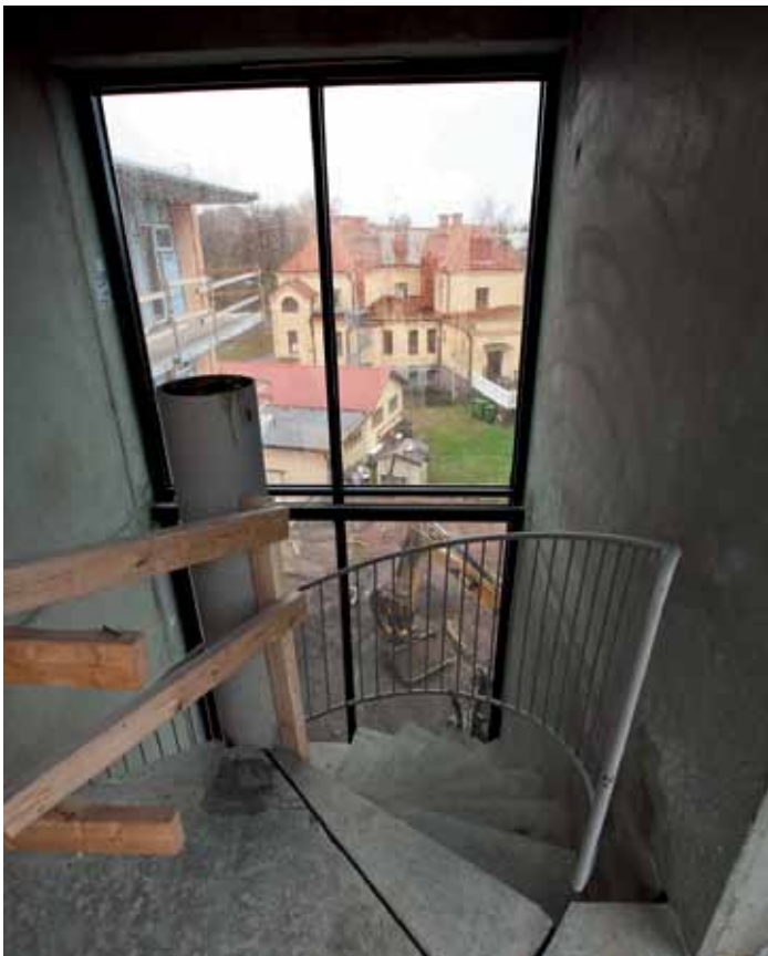
Stora delar av trapphusen har glasväggar och inredningsdetaljer i ek.