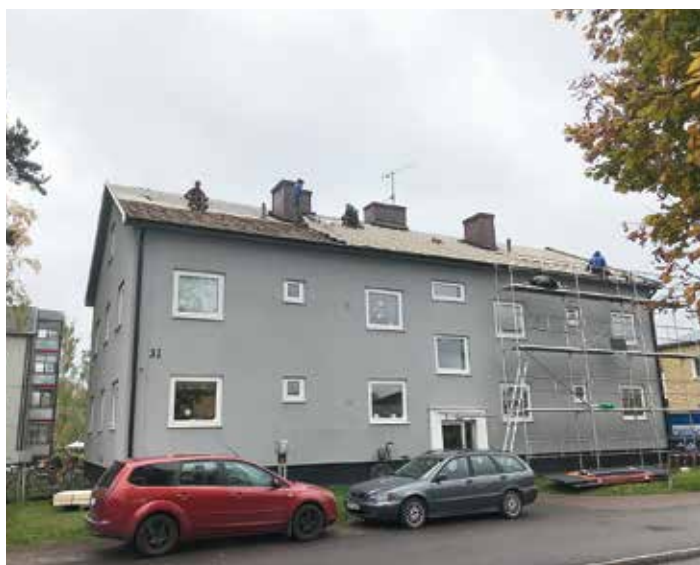
Skrämmande dålig säkerhet för byggnadsarbetarna. Bilden är tagen i Kil i Värmland.