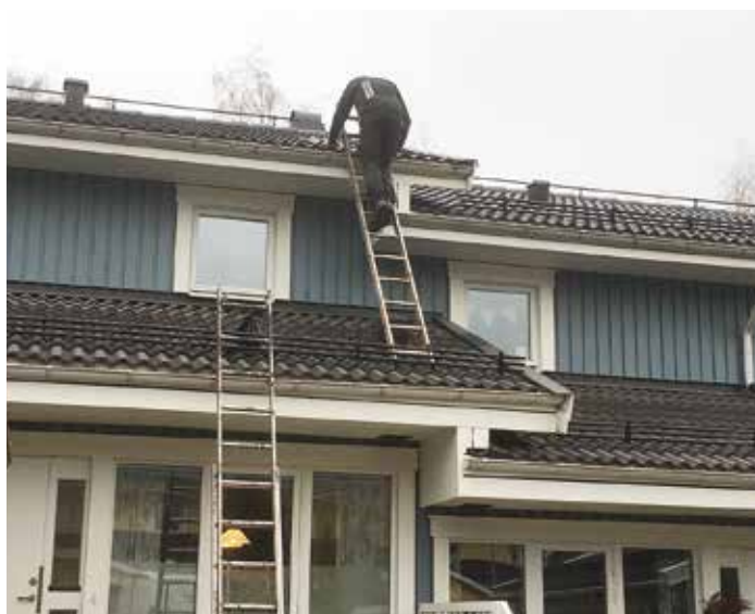
... och på taket till det här huset i Kristinehamn arbetade man helt utan skyddsställningar.