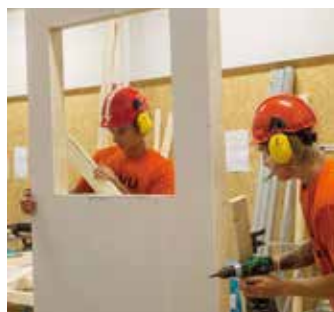
Byggelever i tävlingstagen.