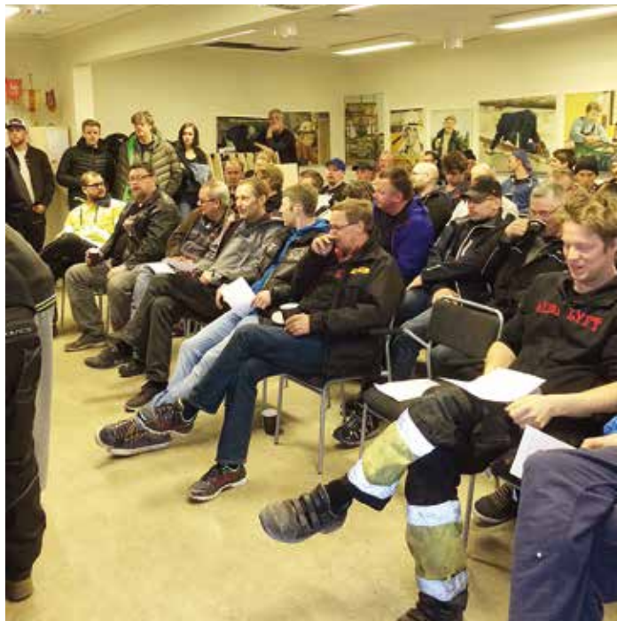
Kampanjan var stor när strejkande byggnadsarbetare samlades på Byggnads i Örebro för att få information.

– Nej, det var så många andra frågor vi ville förbättra. Vi ville ha inflytande och utveckling. Vi tog striden för jämlikhet, jämställdhet och mångfald. Vi tog striden för lärlingarna. Vi fick utvecklat mandat för