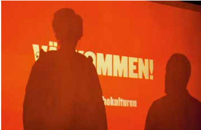
Fler kvinnor till byggbranschen. Det är vad både Byggnads och Byggcheferna vill.

99 procent av Byggnads medlemmar är män. Det är en situation som både Byggnads och Byggcheferna vill ändra på. Bland annat driver man en tvåårig kampanj – Stoppa machokulturen nu.