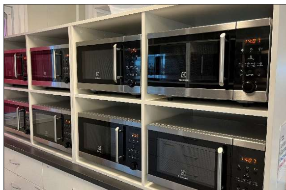
Tillräckligt med mikrovågsugnar är viktigt.

Det behövs ett tillräckligt antal mikrovågsugnar/värmeskåp så att alla hinner värma inom rimlig tid.