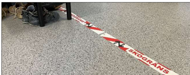
En skogräns är ett bra sätt att få en renare och trevligare miljö i personalutrymmet. Inomhus är det tofflor som gäller.

Alla på arbetsplatsen kan bidra till en ren och trivsamt miljö i personalutrymmena. Inte minst för att underlätta för städpersonalen. En överenskommen ”skogräns” är ett bra sätt att motverka exponering för damm och partiklar.