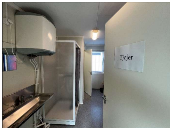
I en större etablering är det lätt att skapa avskiljbara utrymmen med särskilda bodar.

Kollektivavtalet anger att det ska finnas ett låsbart torkutrymme, torkskåp eller motsvarande torkanordning med kapacitet att torka kläder och skor till nästa arbetsdag. Detta innebär att det för arbetsplatser med arbete utomhus, svett drivande arbete eller som smutsar/blöter ner arbetskläder kan krävas ett särskilt utrymme för effektiv torkning av ytterkläder, regnkläder och skor.