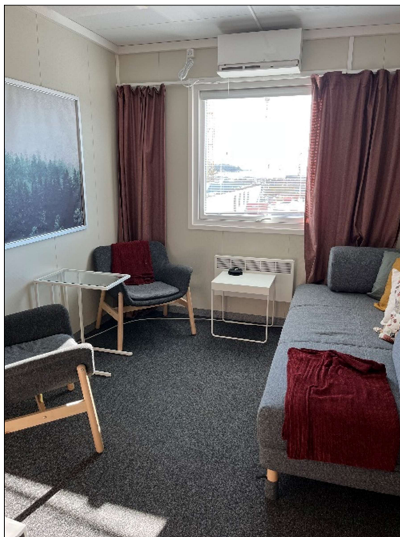
Vilrum behövs på större arbetsplatser. Men även i mindre etableringar ska det gå att ordna för tillfällig, ostörd och liggande vila.

Med en genomtänkt struktur för etableringen kan samarbetet mellan alla på arbetsplatsen underlättas. På större arbetsplatser kan en gemensam yta för raster bidra. Det gäller dock att klokt hantera behovet av rast och vila med möjligheter till arbetsmöten.