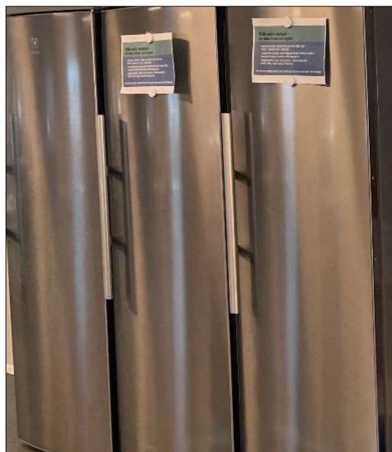
Kylskåpen behöver ibland rymma mat för flera dagar.

Det rekommenderas en (1) toalett per 15 personer som vistas mer än tillfälligt på arbetsplatsen. Det bör dessutom placeras toalettmoduler i nära anslutning till där arbete utförs.