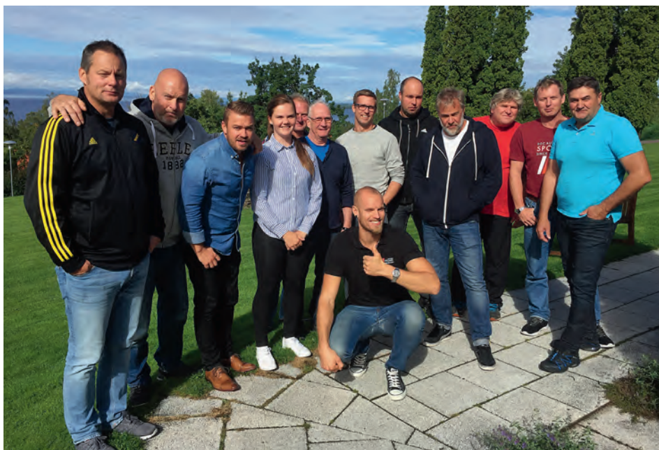
När regionstyrelsen hade styrelsemöte 30 augusti var en av punkterna för dagen, Målplan 2017.

Dessa fyra att-satser är alltså beslutade att gälla i samtliga regioner, dock skall siffrorna anpassas procentuellt till regionens storlek.