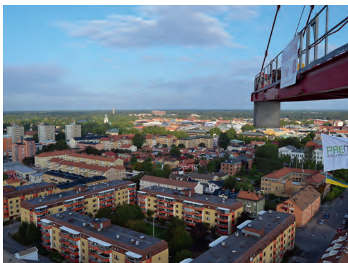
Gävle ur ett annat perspektiv.