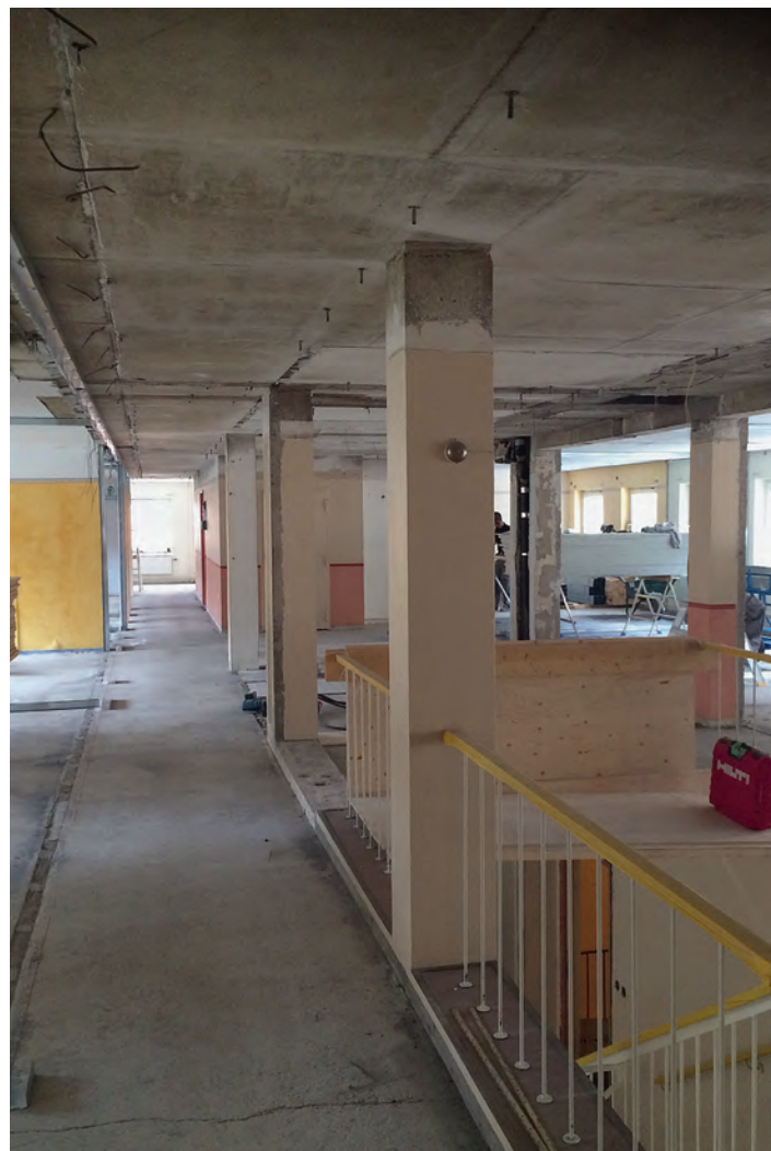
Byggnads kontor i Gävle under renovering.