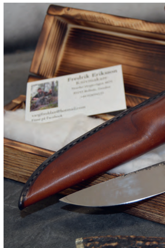
En av de 160 knivar Fredrik tillverkat.

retag, även Fredrik som dock bara haft kontakt brevledes.