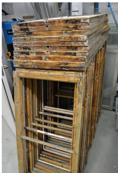
Några av de 150 fönsterbågarna som skall renoveras.