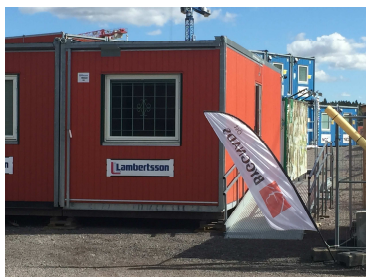
Vår bod med beachflaggan ute

Byggnads Öst har en bemannad bod varje tisdag i Vallastaden, Linköping. Syftet med detta är att vi ombudsmän ska komma närmare den enskilde medlemmen i dess vardag.