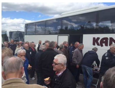
Pensionärsresan 3 juni

Det var 85 glada som åkte iväg i två bussar och dagen till ära hade man tur med vädret.