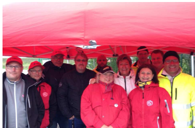
Motala kretsen med LO på speedway den 140819