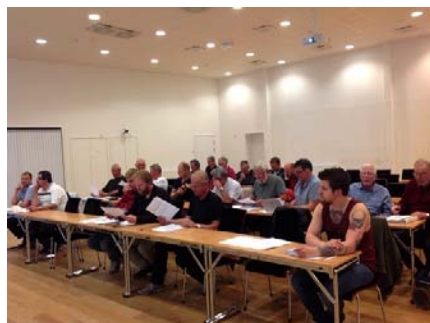
Kretsen & Byggfackens S-förening

Det är även här i kretsen vi nominerar kandidater till olika uppdrag inom politiska uppdrag, föreningar och fackliga uppdrag. Det är på dessa möten vi skriver motioner till avtalsrörelsen och kongresser.