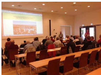
Från medlemskretsmöte 14 maj i år

Medlemskretsarna Kisa och Åtvidaberg och även Byggfackens S-Förening