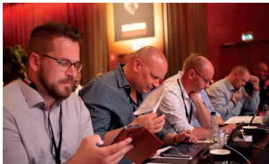
Bild från kongressen 2018.

NU ÄR DET mindre än ett år till nästa kongress (19–22 maj 2022) men det är fortfarande tid kvar för att skicka in motioner. Har du en bra idé så skicka in den. Gå in på www.byggnads.se/om-oss/kongress/2022/ och följ instruktionerna. Är du osäker på hur man gör så ta kontakt med din krets så kan ni hjälpas åt med formuleringen. Sista dagen att skicka in motioner i Skåne är 17 september 2021 . ■