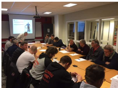
Bild från årsmötet 150121